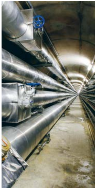
Ausgeklügelte Wärmeverteilung im Flughafen-Untergrund

Gleichzeitig hat die Flughafenbetreiberin schon früh in die CO 2 -arme Wärmeherstellung investiert. Das Dock E, das schon in den 1990er Jahren geplant wurde, ist mit sogenannten Energiepfählen ausgestattet. Diese ermöglichen für das Heizen und Kühlen die Speicherung und Wiedergewinnung von Energie aus dem Untergrund. Die Nutzung dieser un- tiefen Geothermie ist auch ein Konzept für die Zukunft. Auf dem Werkhofareal und bei THE CIRCLE befinden sich zwei weitere Anlagen nach dem gleichen Prinzip im Bau.