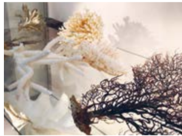
Auch Korallen sind geschützt.

Eidgenössische Zollverwaltung, klärt auf: «Es ist grundsätzlich verboten, Marken- und Designerfälschungen einzuführen. Dasselbe gilt für Lebensmittel tierischer Herkunft oder Pflanzenwaren aus Nicht-EU- und Nicht-EFTA-Ländern.» Manchmal werden auch kuriose Gegenstände wie Kleidungsstücke aus Reptilienhaut, asiatische Kampfwaffen oder gar Schrupfköpfe in Gepäckstücken entdeckt. Einige dieser Exemplare werden zu Schulungszwecken aufbewahrt. In der Regel werden aber alle beschlagnahmten Waren und Lebensmittel vernichtet.