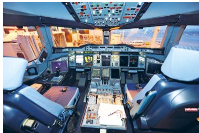
Das Cockpit der Testmaschine, ausgerüstet mit vielen Bildschirmen.