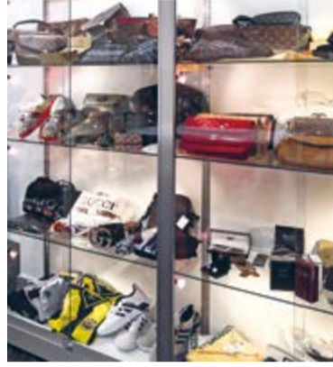
Sehr beliebt: gefälschte Taschen.