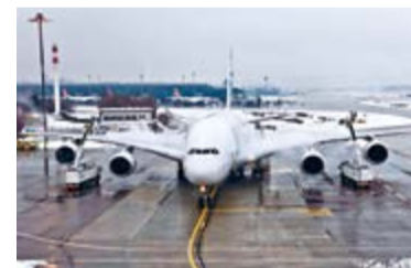
Auch das Enteisung wurde getestet.

Das bedeutet aber nicht, dass der A380 ab dann nicht mehr nach Zürich fliegen wird. Das grösste Passagierflugzeug der Welt wird noch einige Jahre in der Luft und sicher auch am Flughafen Zürich zu bestaunen sein. Singapore Airlines bedient den grössten Schweizer Flughafen nun schon seit neun Jahren täglich mit dem Airbus A380. Mit den zwei täglichen Verbindungen von Emirates aus Dubai können Flughafen- und Flugbegeisterte diese Grossraumflugzeuge weiterhin in Zürich bestaunen.