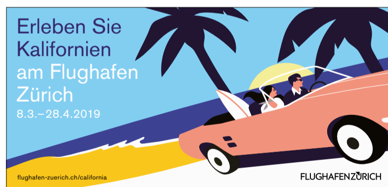
Mehr Informationen zum California Special: www.flughafen-zuerich.ch/california

Was macht die Faszination um den Golden State Kalifornien aus? Reisende und Besucher des Flughafens Zürich haben zwischen dem 8. März und dem 28. April 2019 Gelegenheit, genau das herauszufinden. Teile des Airport Center und der Ankunftshallen verwandeln sich während dieser Zeit in Kulissen aus Sandstrand und Palmen. Das gibt Passagieren und Besuchern des Flughafens die Möglichkeit, einen Moment abzuschalten und den American Lifestyle zu geniessen oder kennenzulernen. Das California Special am «ZRH» erinnert an einen erlebnisreichen Roadtrip auf dem weltberühmten Highway 1 mit all