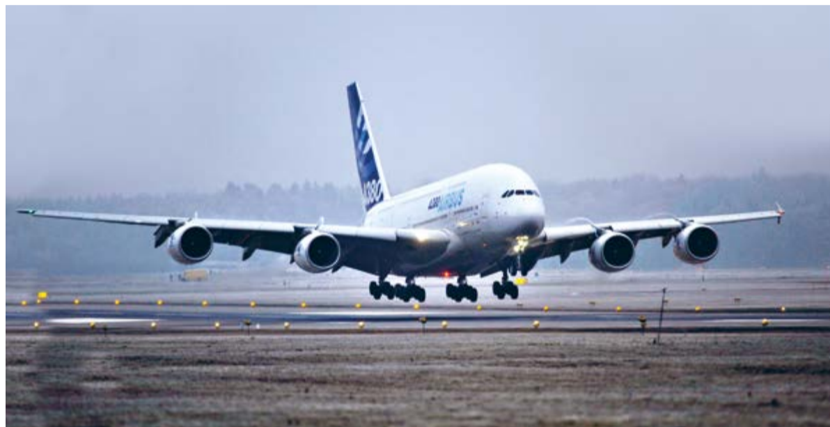
Es war grau und kalt, als erstmals ein Airbus A380 in Zürich landete.

So beginnt die Geschichte des grössten Passagierflugzeugs der Welt, des A380, am Flughafen Zürich. Damals im Januar 2010 landete eine Werksmaschine von Airbus in Zürich. Das Spektakel wurde von rund 22'000 Menschen am Flughafen Zürich live verfolgt. Damit ab Sommerflugplan 2010 Singapore Airlines regelmässig mit dem A380 nach Zürich fliegen konnte, bedurfte es zunächst diverser technischer Tests.